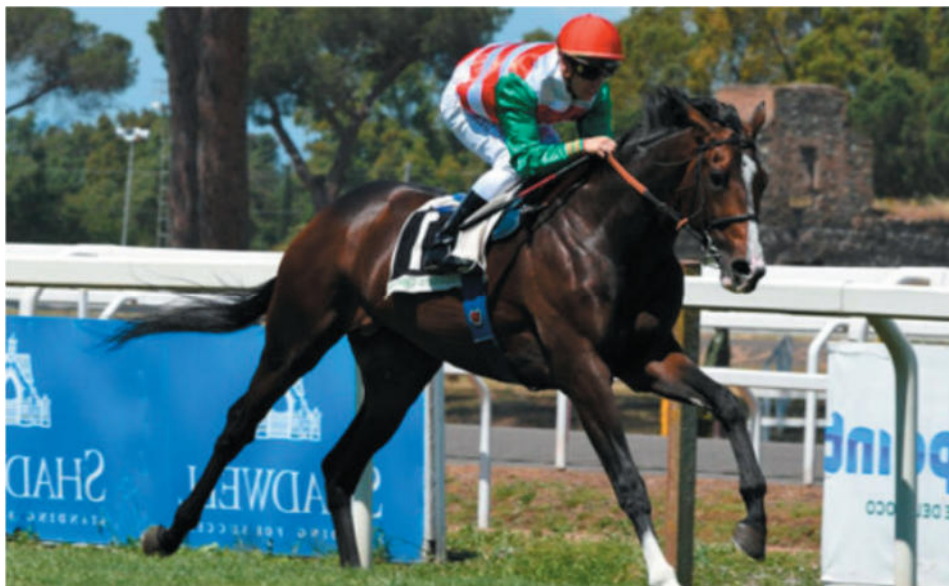
Full Drago, campione italiano per due anni consecutivi

Vincitore di $ 1,000,000 a 2 anni, 1° Breeders' Cup Juvenile Turf, Gr.2 e 2° Prix Jean-Luc Lagardère, Gr.1